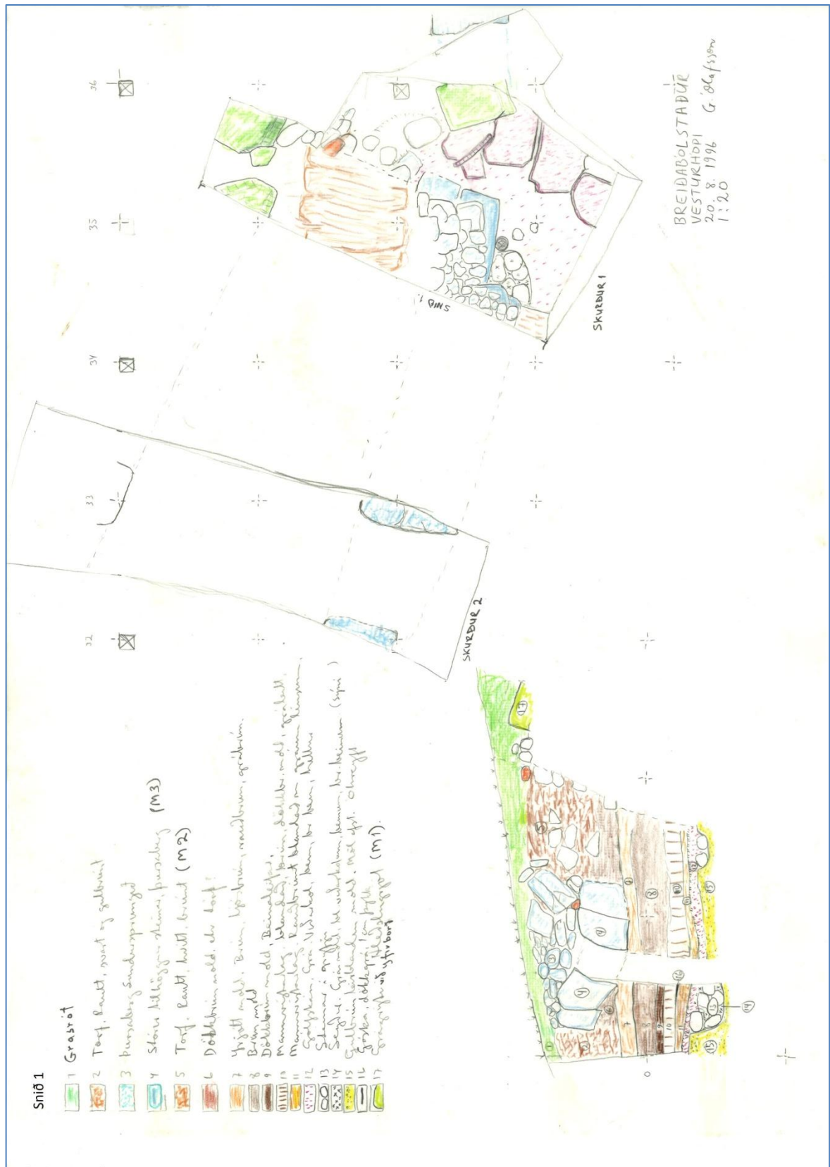
Mynd 6. Frumteikning af svæðinu sem sýnir skurði 1 og tvö ásamt sniðteikningu úr skurði 1 með skýringum á einstökum lögum (Teikning 1. Guðmundur Ólafsson).

og fannst í skurði 1. Yfir gjóskunni var um 4 cm þykkt dökkbrúnt mannvistarlag fyrir miðjum skurði.