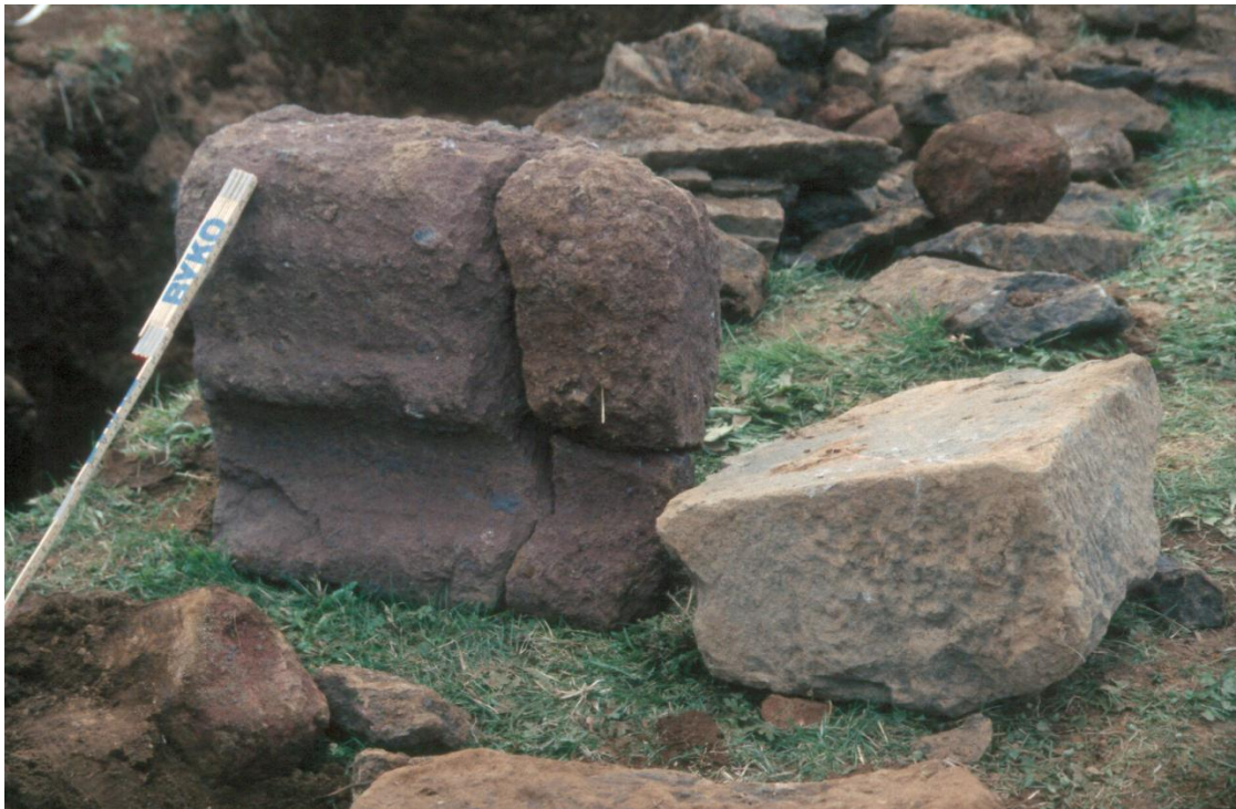
Mynd 10. Tilhöggvinnir steinar (ÞJMS 1996:153 og 154) sem komu upp úr skurði 1 (GÓL-1996-21-12).