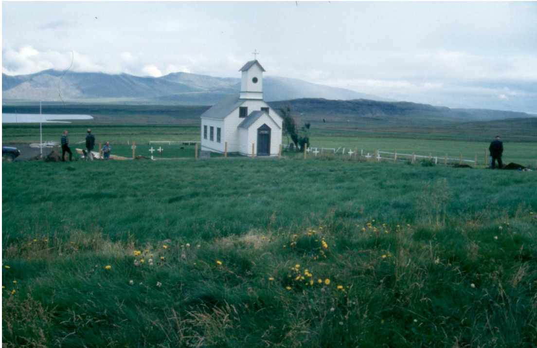
Mynd 2. Yfirlitsmynd af kirkjunni og nýju girðingunni. Tilhöggnu steinarnir fundust við norðvesturhorn kirkjugarðsins þar sem mennirnir standa. Könnunarskurður númer 3 sést lengst til hægri. (GÓL-1996-21-10).