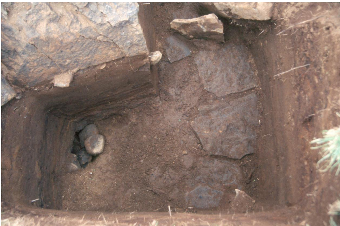
Mynd 9. Austasti hluti í skurði 1 sem sýnir gólf og seyði í elsta mannvirkinu, grjótgarðinn yfir því og þykkt mannvistarlaga þar á milli (GÓL-1996-21-7).

Hellan sem komið var niður á í skurði 3 er tengist hugsanlega mannvirki (M5) sem stóð eða stóð til að byggja á svæðinu vestan við núverandi kirkju og kirkjugarð. Hins vegar er ekki hægt að tengja þessa hellu eða tilhöggnu steinana sem fundust í skurði 1 við ætlaðar byggingarframkvæmdir við steinkirkju á miðöldum, nema að umfangsmeiri fornleifarannsókn geti leitt slíkt í ljós. Tilhöggnu steinarnir eru einstakur fundur á Íslandi og það verður að teljast merkileg tilviljun að þeir skyldu finnast á þeim eina stað sem heimildir eru um að byggja hafi átt steinkirkju á Íslandi á miðöldum. Sú litla fornleifakönnun sem þessi skýrsla fjallar um, hefur því fyrst og fremst leitt í ljós að á Breiðabólstað leynast mjög forvitnilegar og ekki síst óvenjulegar og spennandi minjar í jörðu, sem ná allt aftur á landnámsöld, minjar sem vakið hafa upp margar spurningar og sem væru mjög áhugavert rannsóknarefni síðar meir.