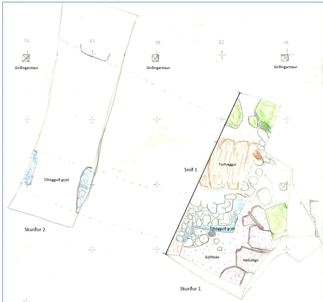
Mynd 4. Grunnmynd af skurði 1 og skurði 2, sem teknir voru við norðvestur horn kirkjugarðssins sem verið var að girða af (Hluti af teikningu 1. Guðmundur Ólafsson).