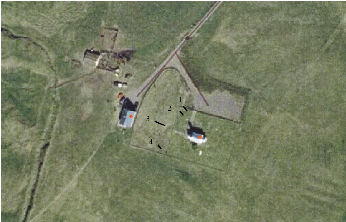
Loftmynd af Breiðabólstað í Vesturhópi, fengin af heimasíðu Þjóðskrár Íslands. Bæjarhúsin eru til vinstri og kirkjan með kirkjugarði til hægri. Könnunarskurðirnir fjórir hafa verið settir inn á kortið. (Fasteignamat ríkisins/Loftmyndir ehf. 2009)

© Þjóðminjasafn Íslands/Guðmundur Ólafsson/Hjörleifur Stefánsson Öll réttindi áskilin.