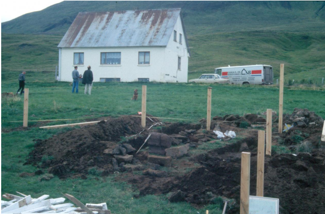
Mynd 1. Nýju girðingarstaurarnir við norðausturhorn kirkjugarðsins á Breiðabólstað. Tilhöggnu steinarnir sem komu í ljós eru á miðri mynd. Í baksýn er íbúðarhúsið á Breiðabólstað (GÓL-1996-21-14).