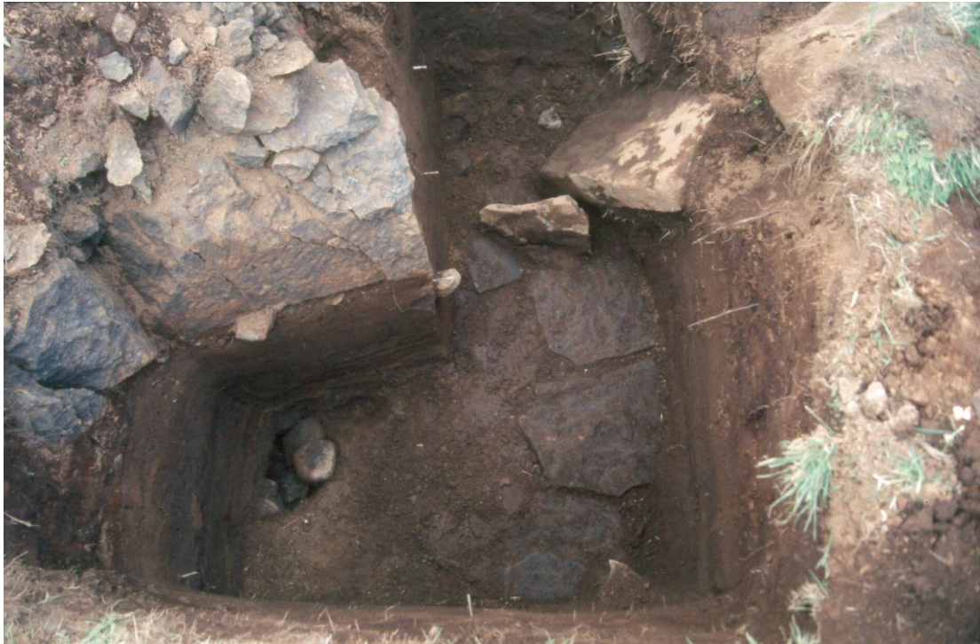
Mynd 3. Horft yfir skurð 1. Í botni er gólfskán með hellulögn til hægri, þar sem ein hellan stendur upp á rönd. Vinstra megin sést steinahrúga í lítilli gryfju eða soðholu, sem birtist þegar gólfskánin var skafin ofan af. Efst til vinstri er stóra grjóthleðslan frá 16. – 19. öld. (GÓL-1996-21-5).