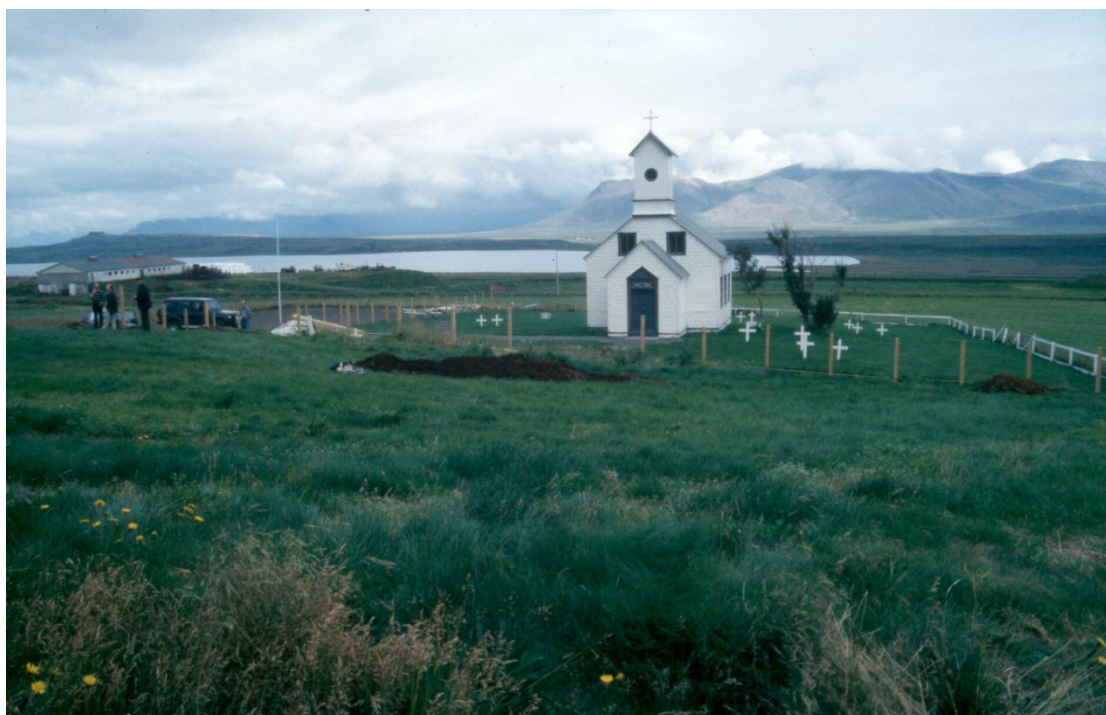
Mynd 8. Horft til austurs yfir könnunarsvæðið á Breiðabólstað. Lengst til vinstri standa men við skurð 1 og 2. Fyrir miðju sést uppmokstur úr skurði 3 og lengst til hægri sést uppmokstur úr skurði 4 (GÓL-1996-21-9).

Mannvirki 5 (M5). Hugsanlega hefur stóra steinhellan, sem fannst í skurði 3, tilheyrt mannvirki sem byggt var úr steini, eða verið efniviður í slíkt mannvirki. Um slíkt er þó ekkert hægt að fullyrða án frekari rannsóknar á staðnum.