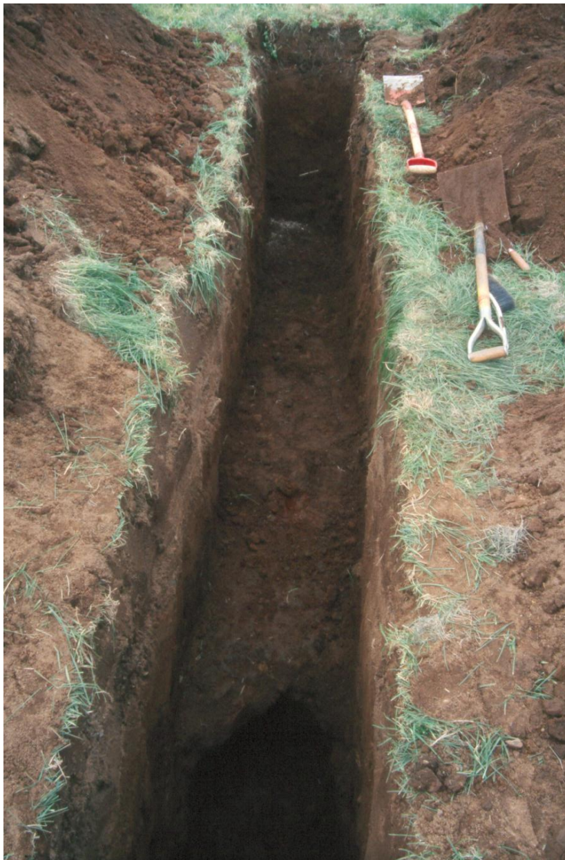
Mynd 7. Horft til vesturs yfir skurð 3. Stór flöt hella lá yfir stærsta hluta skurðarins. (GÓL-1996-21-8).

Í skurðinum var ekki hægt að sjá neina skýra gólfskán eins og í skurði 1, en neðsta mannvistarlagið, þó óskýrt væri, hefur sennilega tilheyrt mannvirki 4 (M4) í skurði 1. Síðan koma mannvistarlög og blönduð mold. Stóra garðhleðslan (M3) var hér um 50 cm undir yfirborði og var a.m.k. um 70 cm breið. Yngsta steinhleðslan (M1) úr grágrýtinu í skurði 1, fannst líka vestast í skurði 2, í línu við nýju girðinguna, og var þar um 40 cm undir yfirborði.